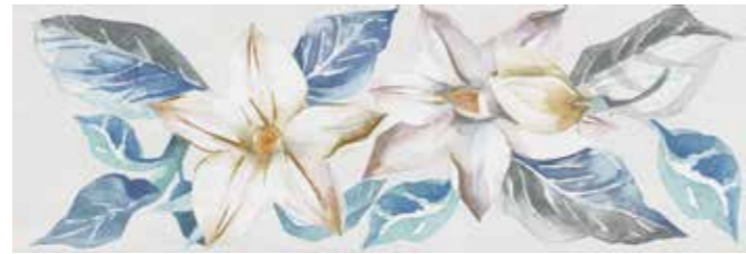
CIEFL CIELO DECORO FLOREALE 25x75 cm 10"x30" 85 MQ