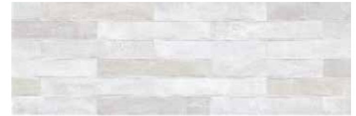
LUXGR LUXOR GRIGIO 25x75 cm 10"x30" 85 MQ