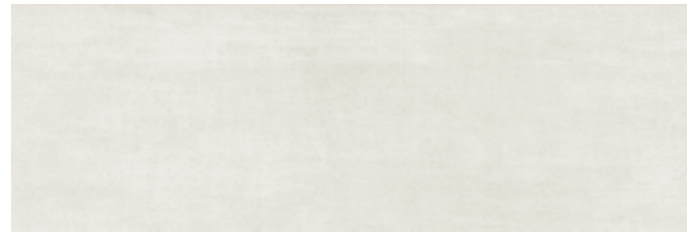
CIEBI CIELO BIANCO 25x75 cm 10"x30" 85 MQ