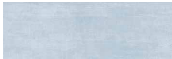
CIEAZ CIELO AZZURRO 25x75 cm 10"x30" 85 MQ