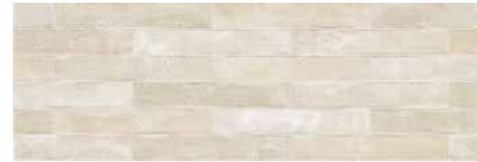
LUXBE LUXOR BEIGE 25x75 cm 10"x30" 85 MQ