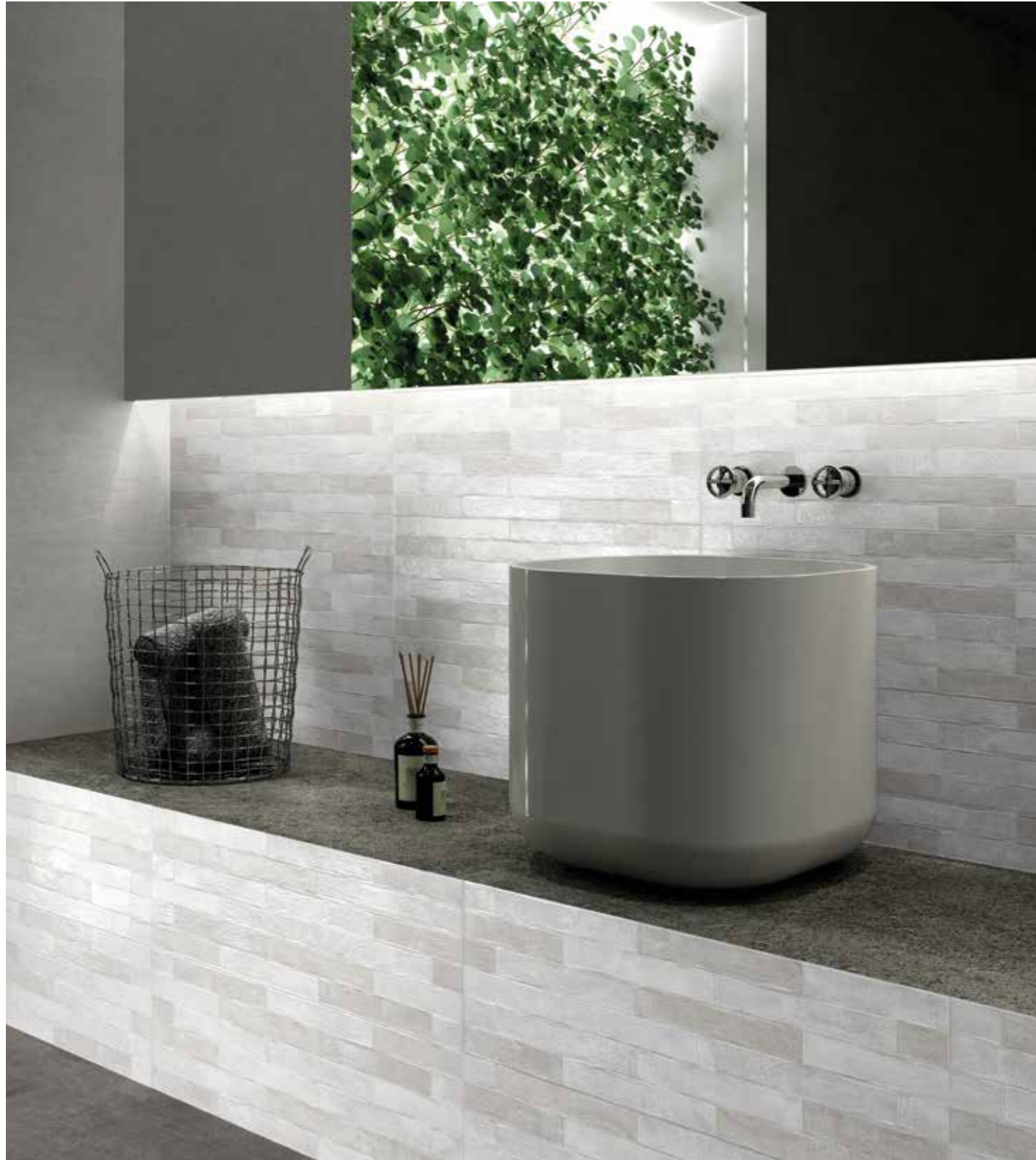
LUXOR GRIGIO 25x75 cm 10"x30" // AREA ANTRACITE 60x60 cm 24"x24"

25x75 cm 10"x30" ≅ 8,3 mm BICOTTURA DOUBLE-FIRED