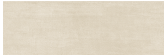
CIEBE CIELO BEIGE 25x75 cm 10"x30" 85 MQ