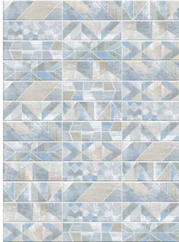
CIEGE CIELO DECORO GEOMETRICO 25x75 cm 10"x30" (4 soggetti grafici / graphic designs) 85 MQ