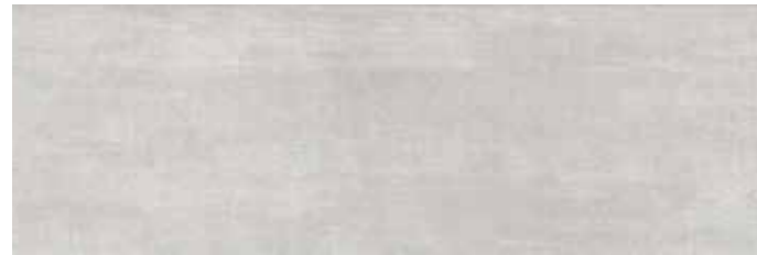
CIEGR CIELO GRIGIO 25x75 cm 10"x30" 85 MQ