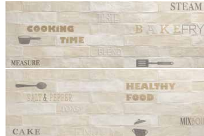
LUXDEBE LUXOR DECORO BEIGE 25x75 cm 10"x30" (2 soggetti grafici / graphic designs) 89 PZ